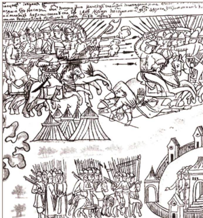
3. Сражение с кочевниками сибирских служилых людей и возвращение их в русский острог. Рис. кон. XVII–нач.XVIII вв.

Почти одновременно с приступом в конце июля 1662 г. к Китайскому острогу, его осадой, разграблением окрестностей и соседних владений Далматовского Успенского монастыря на Исети 28 (акции, вероятно, были скоординированы), на западном склоне Среднего Урала совершено нападение окрестных ясачных на чу-