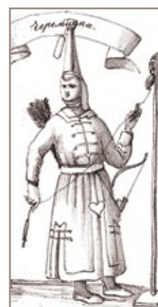
2. Черемиска. Рис. XVII в. (Рисунки к путешествию по России римско-императорского посланника барона Мейерберга в 1661 и 1662 годах, представляющие виды, народные обычаи, одеяния, портреты и т.п.)

Причиной такой задержки явилось, конечно, башкирское восстание, начавшееся в 1662 г. и продолжавшееся до 1665 г. К башкирам присоединились жители ясачных волостей Приуралья, южной части Среднего Урала и Зауралья, недовольные, в частности, появлением русских поселений на их землях, или поблизости от них. В ходе этой «войны» только в Верхотурском и Тобольском уездах были сожжены десятки деревень и разгромлены некоторые слободы, в том числе все ближайшие к Уктусу (см. далее). Понятно, что в этой обстановке создание новой слободы, да еще на самой границе башкирских земель, было невозможно.